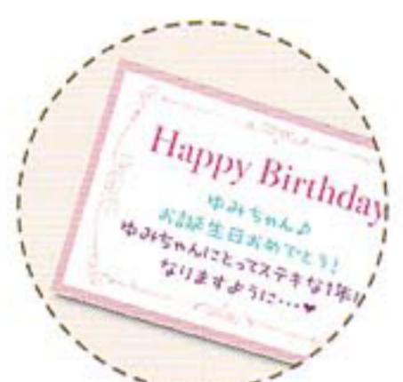
メッセージカードにも