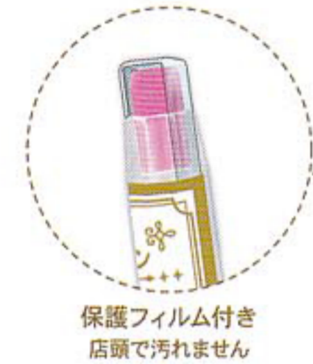
保護フィルム付き 店頭で汚れません

セット (7柄×各20本) ¥25,200 72896-5 4 530344 728965