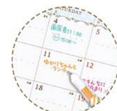
スケジュール帳にも