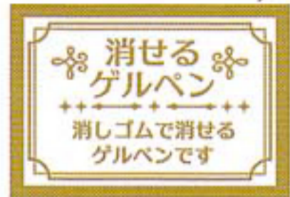
▲アビールシール付き

書いた文字を消しゴムで消せるゲルペンです。 キャップ付属の消しゴムや、市販の消しゴムでも 消すことができます。